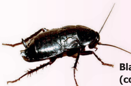
Blatta orientalis (2-3 cm fognature – ambienti umidi) (colore nero)