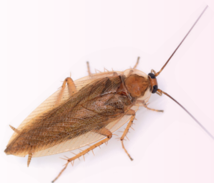
Blatta Germanica (1-1.5 cm, derrate alimentari) (colore marrone chiaro tendente al rosso)

www.ti.ch/prodotti-chimici – nella sezione per saperne di più – documenti, trovate la lista delle ditte ticinesi autorizzate