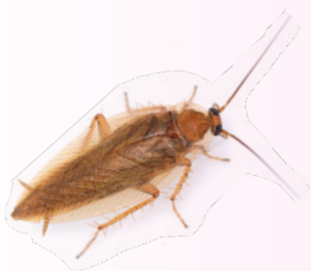
Blatta Germanica (1-1.5 cm, derrate alimentari) (colore marrone chiaro tendente al rosso)

www.ti.ch/prodotti-chimici – nella sezione per saperne di più – documenti, trovate la lista delle ditte ticinesi autorizzate