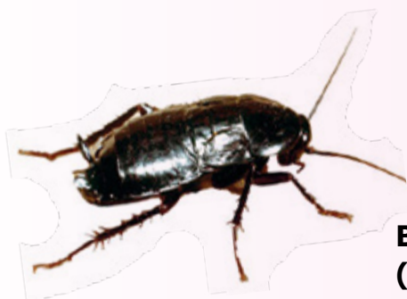
Blatta orientalis (2-3 cm fognature – ambienti umidi) (colore nero)